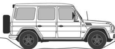
In-/uitloophoek voor 36° en achter 39°