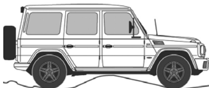
Bodemvrijheid 24,5 cm