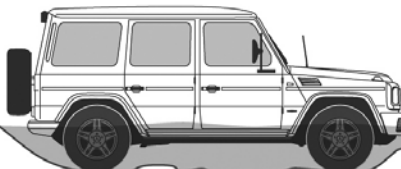
Maximale waaddiepte 60 cm