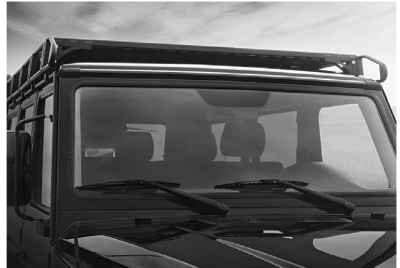
Dakdrager, code F50