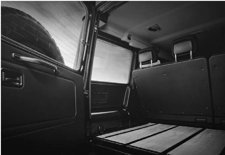
Bagageruimte in houtuitvoering, code VV1