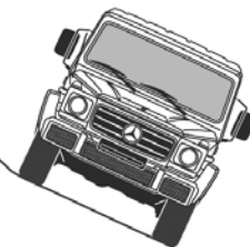
Stabiliteit tot onder een schuine hoek van 54%