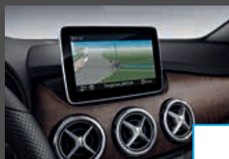
COMAND Online (531) € 2.118