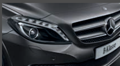
Bi-XENON koplampen (614)