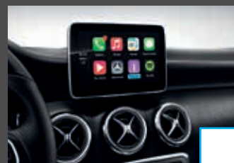
Smartphone integratie (14U) € 363