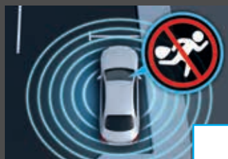
Antidiefstalpakket (P54) € 496