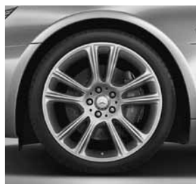
48,3 cm (19 inch) vijf-dubbel- spaaaks lichtmetalen velg (R17)