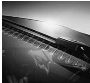
MAGIC VISION CONTROL