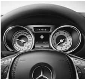
Combi-instrument met display snelheidslimietassistent