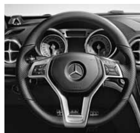
Multifunctioneel sportstuur met drie spaken