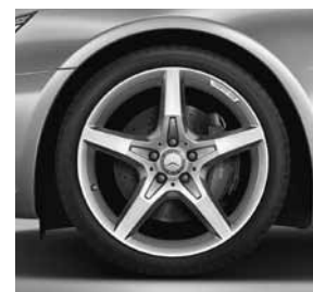
48,3 cm (19 inch) vijfspaaaks licht- metalen AMG-velg (770)