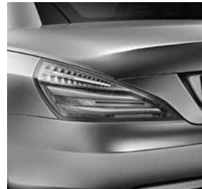
Achterlichten in led-techniek