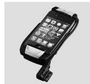
Houder voor Apple iPhone