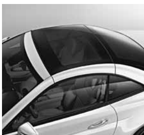
Panoramavariodak met MAGIC SKY CONTROL