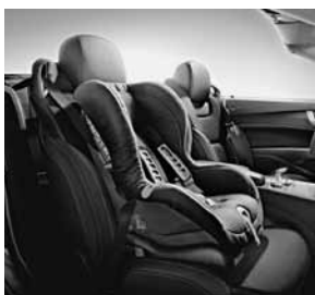
Kinderzitje DUO Plus met ISOFIX