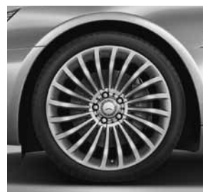
48,3 cm (19 inch) multispaaks lichtmetalen velg (11R)