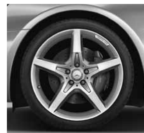
48,3 cm (19 inch) vijfspaaks lichtmetalen AMG-velg, glanzend