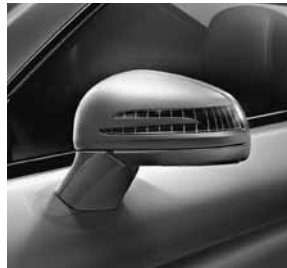
Buitenspiegels links en rechts verwarmd en elektrisch instelbaar