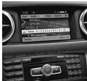
COMAND Online met dvd- wisselaar voor zes dvd's (standaard bij de SL 500)