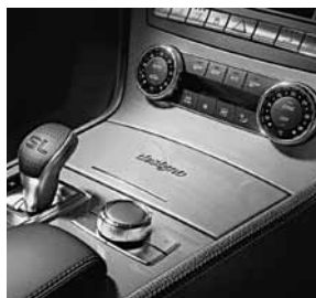
designo sierdelen in pianolak champagnewit