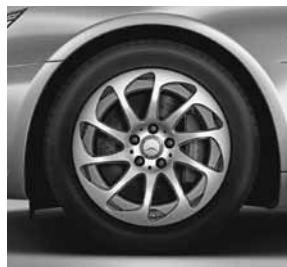
43,2 cm (17 inch) tienspaaks lichtmetalen velg (25R/2R9)