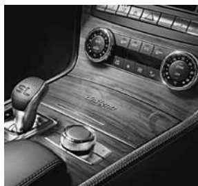
designo sierdelen in bamboe natureel