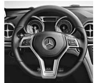
Multifunctioneel sportstuur met drie spaken