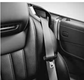
designo veiligheidsgordel in rood