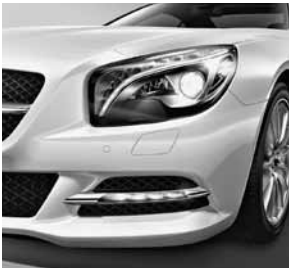
Intelligent Light System