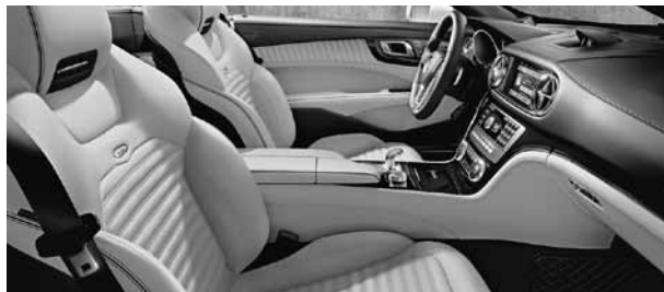
Bekleding designo leder Exclusief platinawit