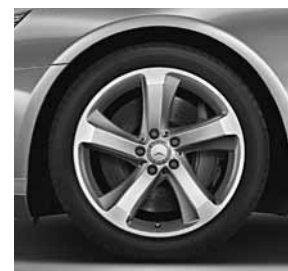
Vijfspaaks lichtmetalen velg