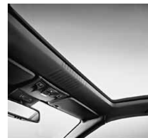
designo interieurhemel in leder zwart