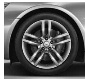
45,7 cm (18 inch) vijf-dubbel- spaaaks lichtmetalen velg (R70)