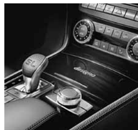
designo sierdelen in pianolak zwart