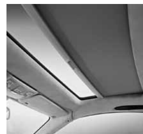
Panoramavariodak transparant met zonnescherm