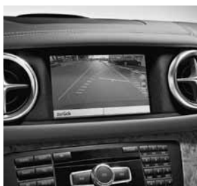
Achteruitrijcamera met hulplijnen