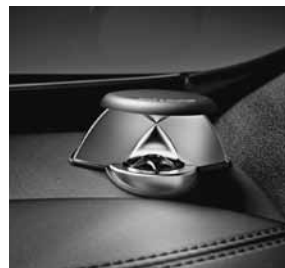
Bang & Olufsen BeoSound AMG