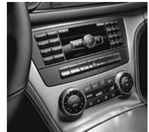
Sierdelen in aluminium geslepen licht