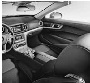
Bekleding stof/leder zwart