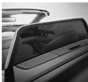
Elektrisch bediend windscherm