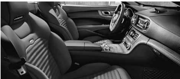
Bekleding designo leder sienabruin