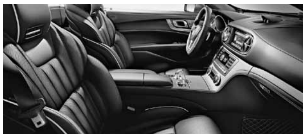
Bekleding nappaleder Exclusief geperforeerd zwart