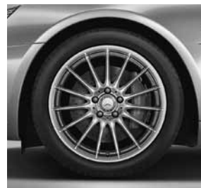
45,7 cm (18 inch) vijftienspaaks lichtmetalen velg (R34/40R/3R9)