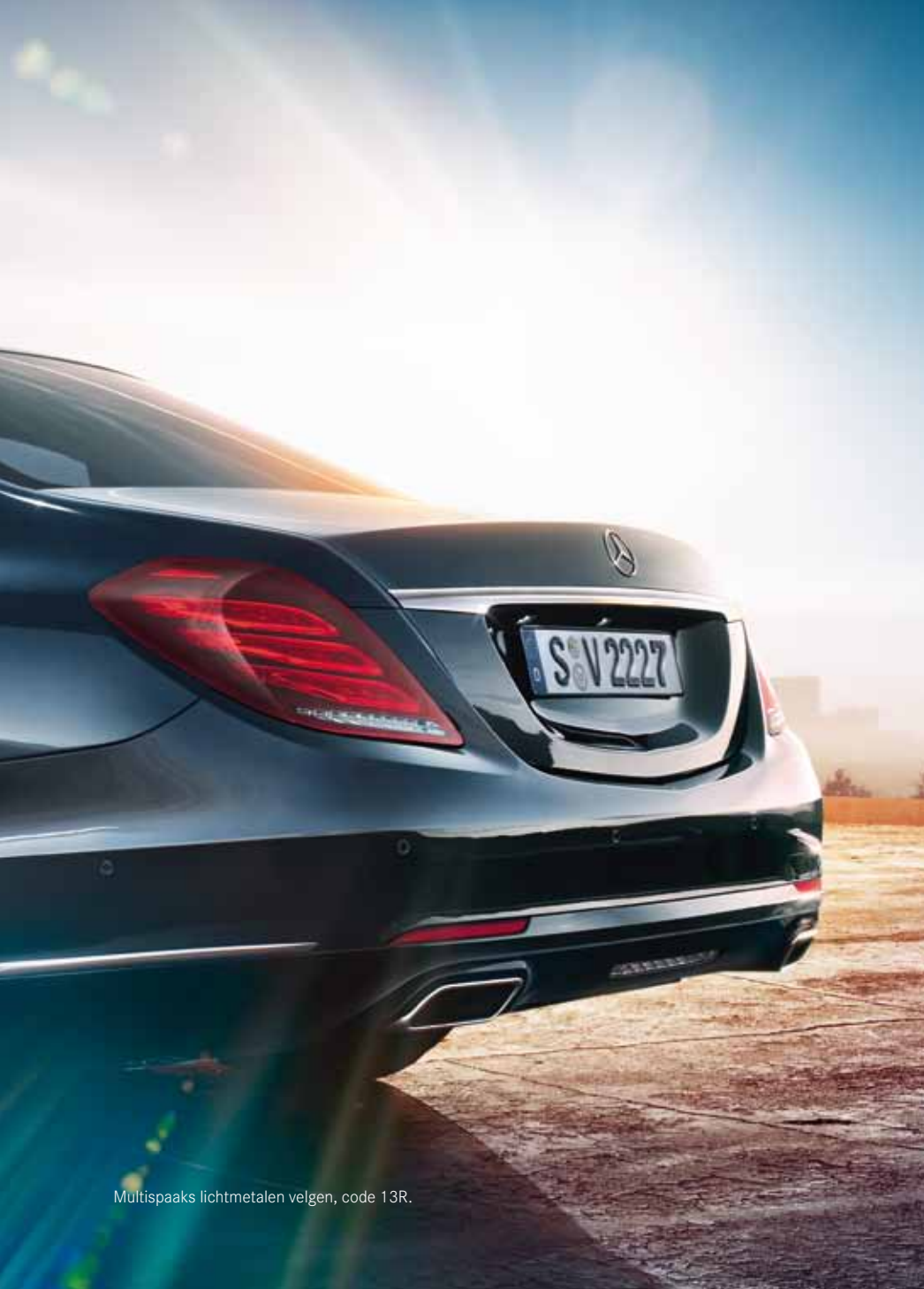
Multispaaks lichtmetalen velgen, code 13R.