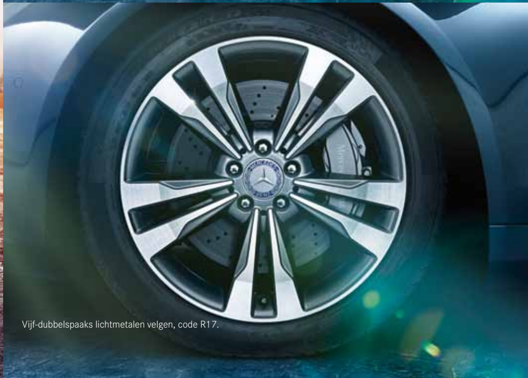
Vijf-dubbelspaaks lichtmetalen velgen, code R17.