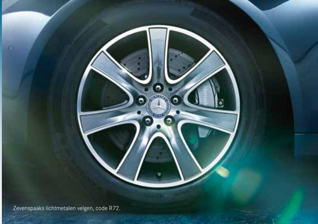
Zevenspaaks lichtmetalen velgen, code R72.