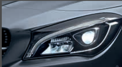
High-performance led-koplampen (632)