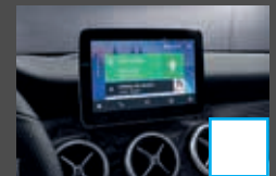
Smartphone integratie (14U) € 363

- 43,2 cm (17 inch) vijfspaaks lichtmetalen velgen (02R) € 0