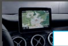
COMAND Online (531) € 2.118