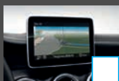
COMAND Online (531) € 2.118