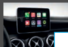
Smartphone integratie (14U) € 363