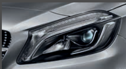
High-performance led-koplampen (632)