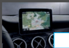
COMAND Online (531) € 2.299