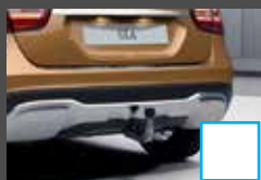
Trekhaak (550) € 956