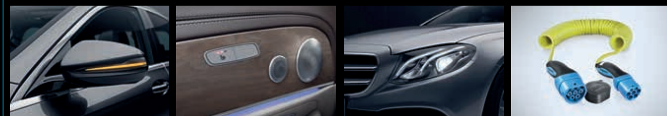
Spiegelpakket (P49): automatisch dimmende binnen en linker buitenspiegel en buitenspiegels elektrisch inklapbaar