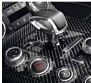
Plakette »FINAL EDITION - 1 of 350«