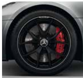
48,3 cm (19") / 50,8 cm (20") AMG Schmiereräder im Kreuzspeichen-Design (699)