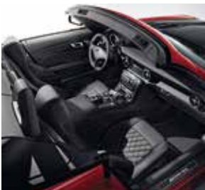
Innenansicht FINAL EDITION