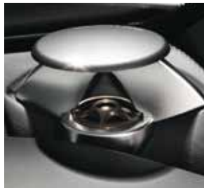
Hochtöner Bang & Olufsen BeoSound AMG