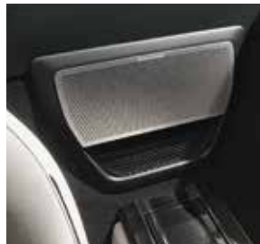
Subwoofer Bang & Olufsen BeoSound AMG