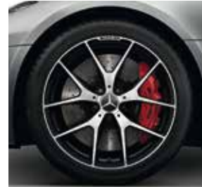
48,3 cm (19")/50,8 cm (20") AMG Schmiederäder im Kreuzspeichen- Design (697)