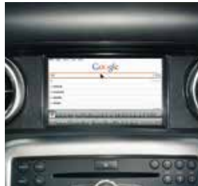
AMG Performance Media