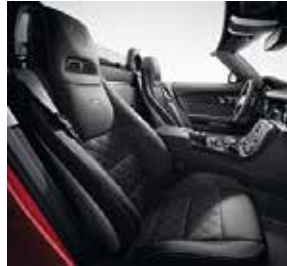
designo Leder Exklusiv mit Rauten Design