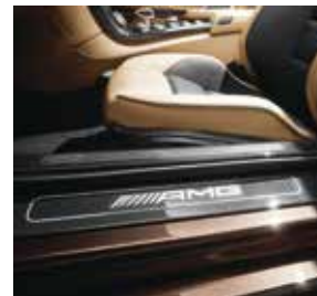
AMG Carbon-Paket Interieur