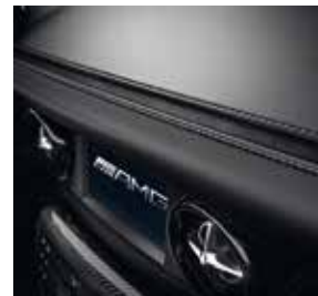
»3D-Needle« in Alcantara® mit Kontrastziernähten in Silber