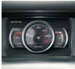
AMG Performance Media