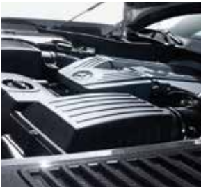
AMG Carbon Motorraumabdeckung