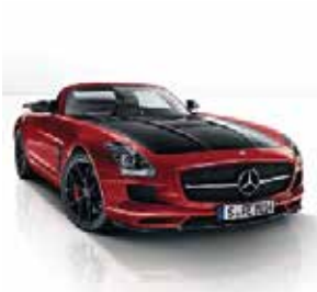
Frontansicht FINAL EDITION