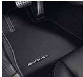
AMG Fußmatten schwarz mit Ledereinfassung in Silber