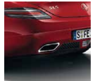
Heckstoßfänger mit Endrohrblenden