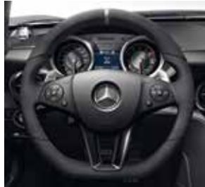
AMG Performance Lenkrad