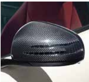
AMG Carbon Außenspiegel