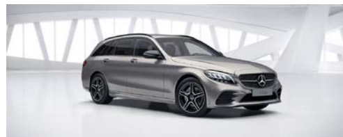
859 - Mojave zilver