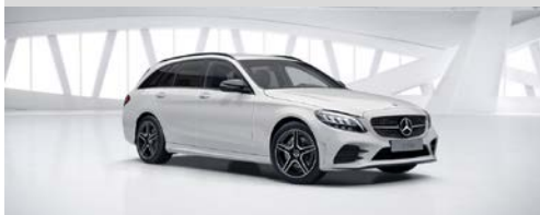
149 - Poolwit