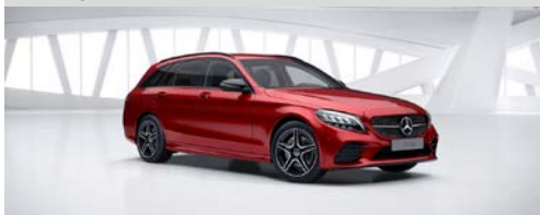
996 - Hyacintrood (1)