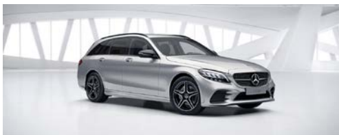
775 - Iridium zilver