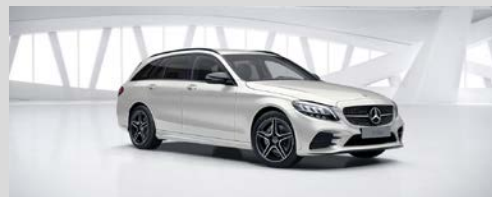
799 - Diamantwit (2)