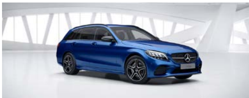
896 - Briljantblauw