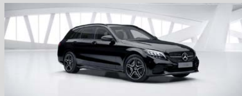
040 - Nachtzwart