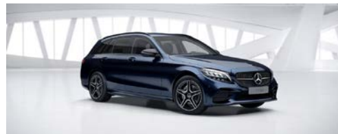
890 - Cavansietblauw