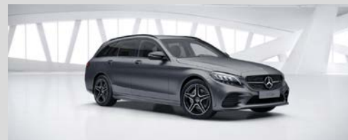
297 - Selenietgrijs magno