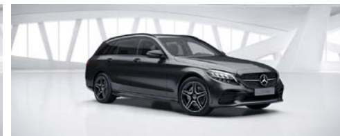
831 - Grafietgrijs