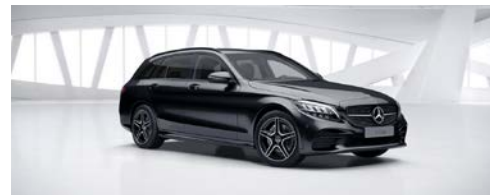
197 - Obsidiaanzwart