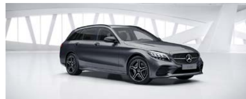
992 - Selenietgrijs