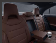
Armsteun achter (400)