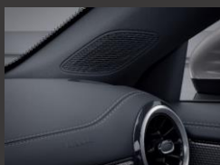
Advanced Sound System (853)