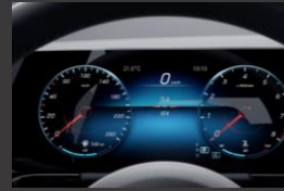
Widescreen cockpit (458)