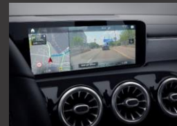
Augmented reality voor navigatie (U19)