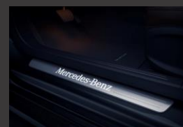
Verlichte instaplijsten (U25)