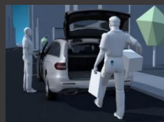
KEYLESS-GO package (P17)