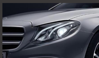
High-performance LED-koplampen (632)