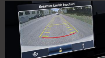
Parkeerpakket inclusief achteruitrijcamera (P44)