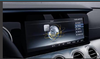
Mediadisplay 12,3 inch (868)