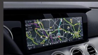
Mercedes-Benz navigatie (357)