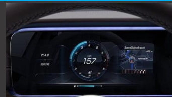
Widescreen cockpit (464)