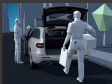
KEYLESS-GO package (P17)