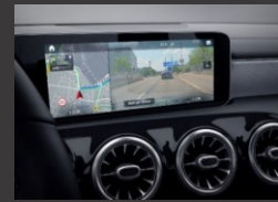
Augmented reality voor navigatie (U19)