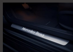
Verlichte instaplijsten (U25)