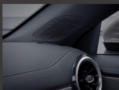
Advanced Sound System (853)