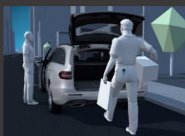
KEYLESS-GO package (P17)