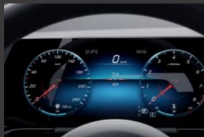
Widescreen cockpit (458)