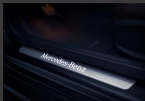
Verlichte instaplijsten (U25)