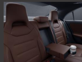
Armsteun achter (400)