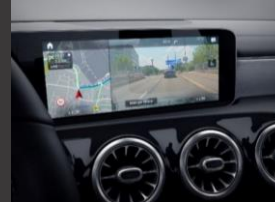
Augmented reality voor navigatie (U19)