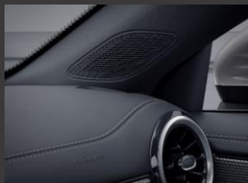
Advanced Sound System (853)