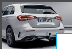
Trekhaak (550) € 968