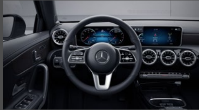
Widescreen cockpit (458)