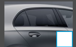
Warmtewerend donkergertint glas (840) € 363