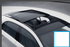
Panormaschuifdak (413) € 1.137