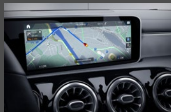
Mercedes-Benz navigatie (365)