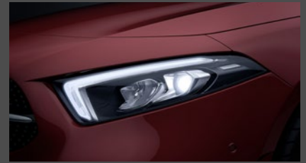
High-performance led-koplampen (632)