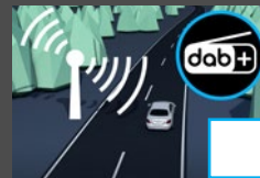
Digitale radio (537) € 242