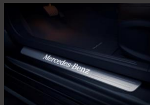
Verlichte instaplijsten (U25)