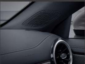
Advanced Sound System (853)