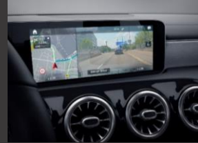
Augmented reality voor navigatie (U19)