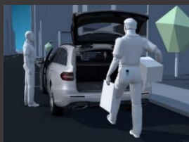
KEYLESS-GO package (P17)