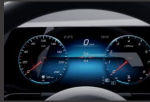
Widescreen cockpit (458)