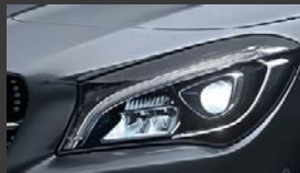
High-performance led-koplampen (632)