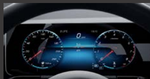
Widescreen cockpit (458)