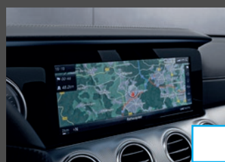
COMAND Online (531) € 1.271