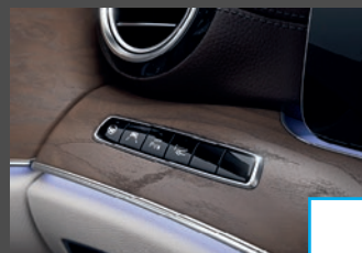
Rijassistentiepakket Plus (P20) € 2.904