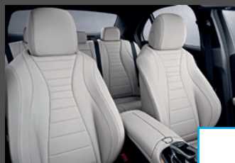
(Nappa)Lederen bekleding (2XX/8XX) (i.c.m. Business solution/AMG) € 2.093/2.662