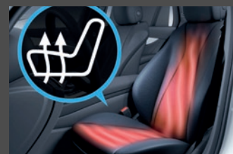
Stoeverwarming voor (873)