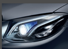
Multibeam LED (P35)