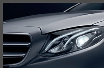
LED high performance koplampen