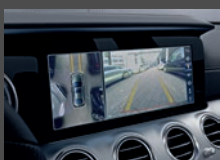
Parkeerpakket met 360°-camera (P47)