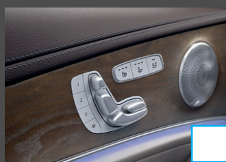
Memorypakket (275) € 1.234