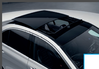
Panoramaschuifdak (413) € 2.142