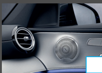
Burmester Surround Sound (810) € 1.029