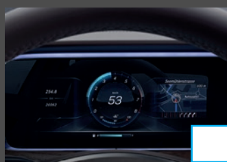
Widescreen cockpit (464) € 1.029