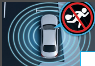
Anti-diefstalpakket (P54) € 532