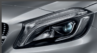
High-performance led-koplampen (632)