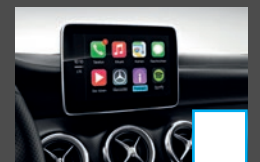
Smartphone integratie (14U) € 363