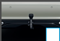
Trekhaak 2) (550) € 956