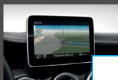
COMAND Online (531) € 2.118