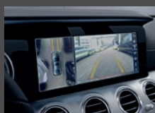
Parkeerpakket met 360°-camera (P47)