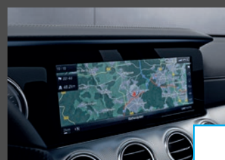
COMAND Online (531) € 1.271