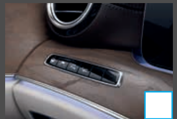
Rijassistentiepakket Plus (P20) € 2.904