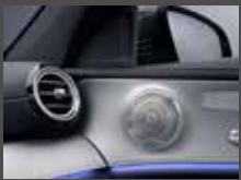
Burmester® surround sound system (810)

Inclusief lederen bekleding (2XX) en nappalederen bekleding (8XX) i.c.m. Business Solution AMG