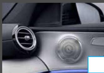
Burmester Surround Sound (810) € 1.029