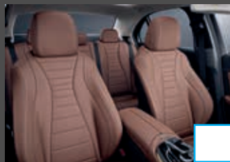
Nappalederen bekleding (8XX) (i.c.m. Business Solution AMG) € 2.662