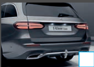
Trekhaak € 1.162