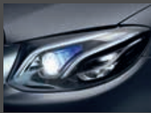
Multibeam LED (P35)