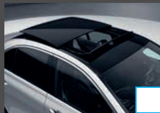
Panoramaschuifdak (413) € 2.142