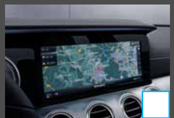
COMAND Online (531) € 1.271