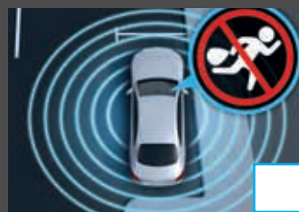
Antidiefstalpakket (P54) € 532