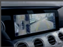
Parkeerpakket met 360°-camera (P47)