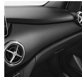
Sierdeel in linelook