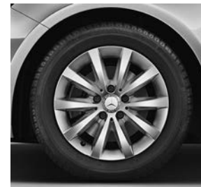
Line Style: 40,6 cm (16 inch) tienspaaks lichtmetalen velgen (55R)