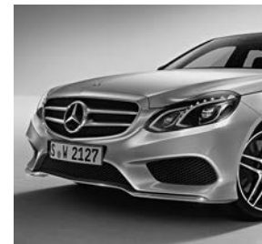
AMG-sportpakket: AMG-styling (772)