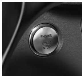
KEYLESS GO-startfunctie (893)

Standaard is de B-Klasse Electric Drive al rijk uitgerust met onder andere: