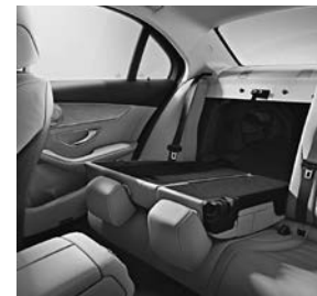
Achterbankleuning in delen neerklapbaar 40/20/40 (287)