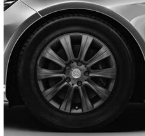
40,6 cm (16 inch) tienspaaks lichtmetalen velgen (55R)