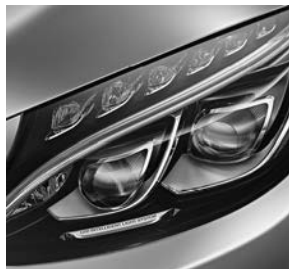
Led-Intelligent Light System (642)