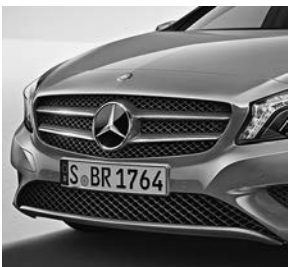
Line Style: grille met twee lamellen in carrosseriekleur en chromoaccenten