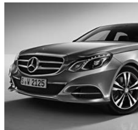
AVANTGARDE: grille met ster en twee lamellen