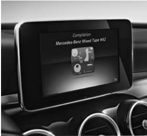
AUDIO 20 CD met touchpad (522)