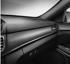
Sierdeel in aluminium structuurgeslepen donker (H79)