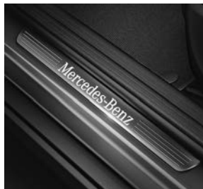
Licht- en zichtpakket (U62), instaplijsten met Mercedes-Benz opschrift, verlicht (U25)