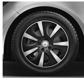
40,6 cm (16 inch) zevenspaaks lichtmetalen velgen (R20) voor CLA 180