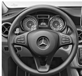
Stuurwiel in leder (280)