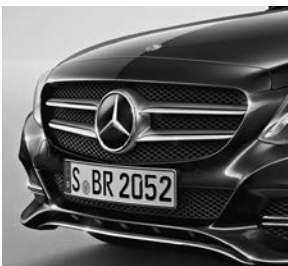
AVANTGARDE exterieur: grille met ster en twee lamellen met chromaccenten

Standaard is de C-Klasse al rijk uitgerust met onder andere: