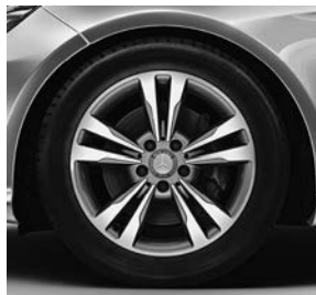
AVANTGARDE: 43,2/45,7 cm (17/18 inch) vijf-dubbelspaaks lichtmetalen velgen (44R)