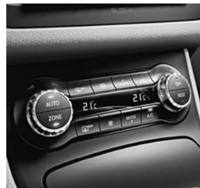
Automatische airconditioning THERMOTRONIC (581)