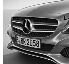
AVANTGARDE exterieur: grille met ster en twee lamellen met chromaccenten

Standaard is de C-Klasse al rijk uitgerust met onder andere: