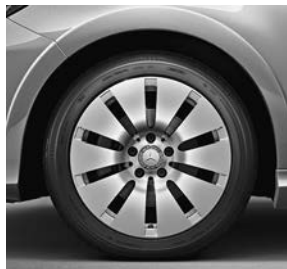
43,2 cm (17 inch) tienspaaks lichtmetalen velgen (25R)