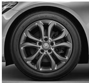
43,2 cm (17 inch) vijf-dubbel spaaks lichtmetalen velgen (80R) voor C180 BlueTEC