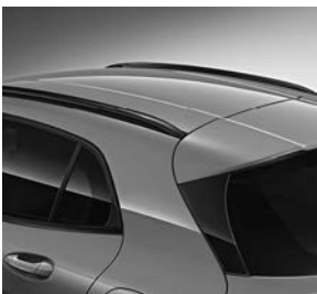
Line Style: dakreling in aluminium zwart hoogglanzend (720)