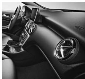
Line Style: sierdeel in matrixlook

Standaard is de A-Klasse al rijk uitgerust met onder andere: