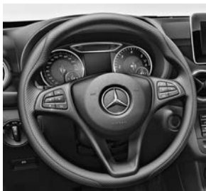
Driespaaks multifunctioneel stuurwiel met applicatie in zilverchrom (442)