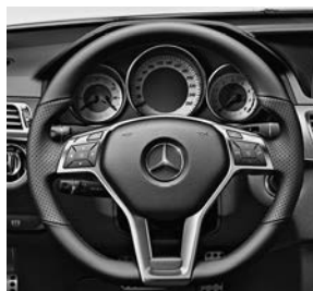
AMG-sportpakket: AMG-sportstuur aan de onderzijde afgevlakt (277)