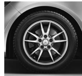
40,6 cm (16 inch) tienspaaks lichtmetalen velgen (39R) voor CLA 180 CDI