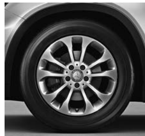
Line Style: 43,2 cm (17 inch) vijf-dubbelspaaks lichtmetalen velgen (R48)