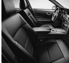
Bekleding in stof Grenoble/ lederlook ARTICO zwart (411)