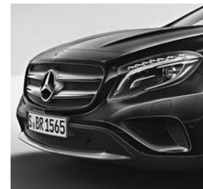
Line Style: grille met twee lamellen in zilverkleur en chromaccenten