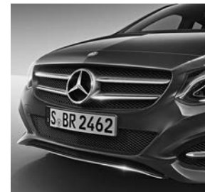
Grille met twee lamellen in iridiumzilver en chromaccenten