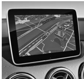
Garmin® MAP PILOT (357) afgebeeld met 20,3 cm TFT-display (857)