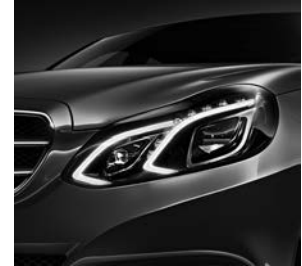
Led-Intelligent Light System (622)

Standaard is de E-Klasse al rijk uitgerust met onder andere: