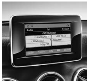
AUDIO 20 CD (523)