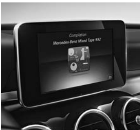
AUDIO 20 CD met touchpad (522)