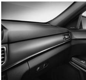
AVANTGARDE: sierdeel in aluminium structuurgeslepen donker (H79)