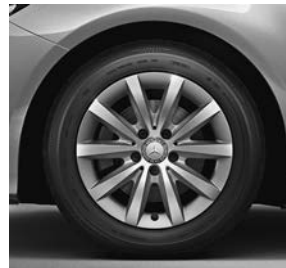
40,6 cm (16 inch) tienspaaks lichtmetalen velgen (55R)