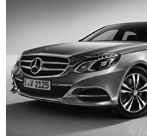
Grille met ster en twee lamellen