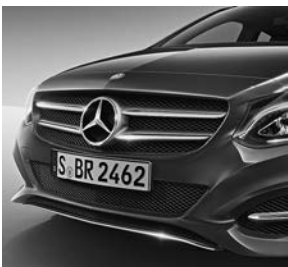
Grille met twee lamellen in iridiumzilver en chromaccenten