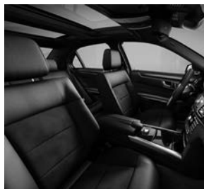
AMG-sportpakket: sportstoelen in ARTICO/DINAMICA zwart met lichte siernaden (611)