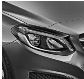
High-performance led-koplampen (632)