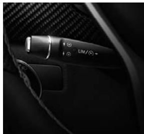
Cruisecontrol, code 440