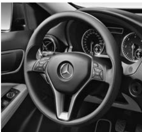
Stuurwiel in leder (280)