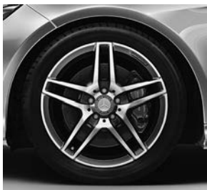
AMG-sportpakket: 45,7 cm (18 inch) vijf-dubbelspaaks lichtmetalen velgen (660)