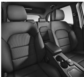
Stoelen met gecontoureerd schouderbereik in stof Vianen (031)