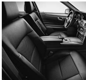
AVANTGARDE: bekleding in stof Grenoble/lederlook ARTICO zwart (411)