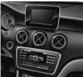
AUDIO 20 CD met CENTRAL MEDIA DISPLAY (523)