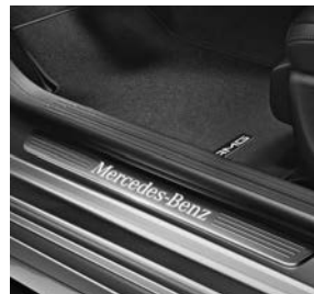
Instaplijst verlicht, onderdeel van licht- en zichtpakket (U62)