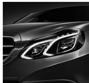
Led-Intelligent Light System (622)

Standaard is de E-Klasse al rijk uitgerust met onder andere: