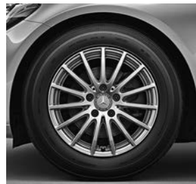
40,6 cm (16 inch) multispaaks lichtmetalen velgen (70R) voor C180