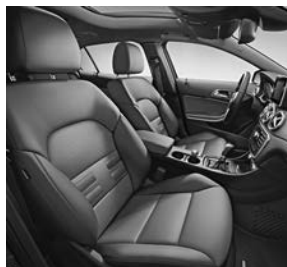
Line Style: comfortstoelen in lederlook ARTICO/stof Dourados (601)

Standaard is de GLA al rijk uitgerust met onder andere: