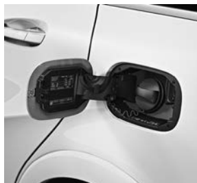
Stekkerdoos voor oplaadkabel