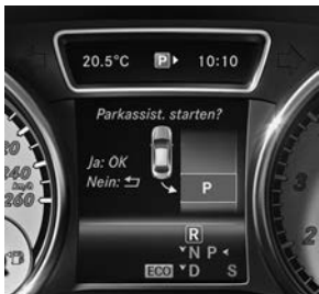
Actieve parkeerassistent inclusief PARKTRONIC, code 235