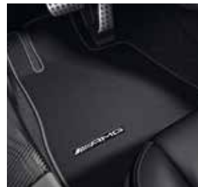
AMG Fußmatten schwarz mit Ledereinfassung in Silber