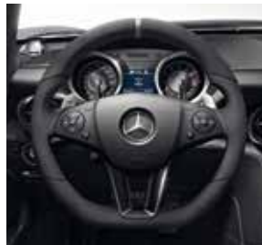
AMG Performance Lenkrad