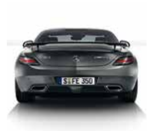
Heckansicht Final Edition