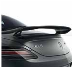
Heckflügel aus Carbon