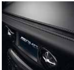
»3D-Naht« in Alcantara® mit Kontrastziernähten in Silber