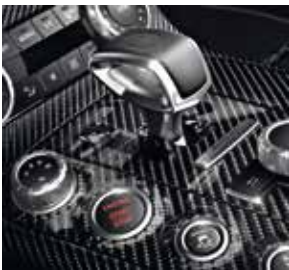
Plakette »FINAL EDITION - 1 of 350«