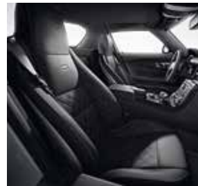
designo Leder Exklusiv mit Rauten Design