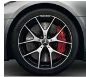
48,3 cm (19")/50,8 cm (20") AMG Schmiederäder im Kreuzspeichen- Design (697)