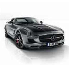
Frontansicht FINAL EDITION