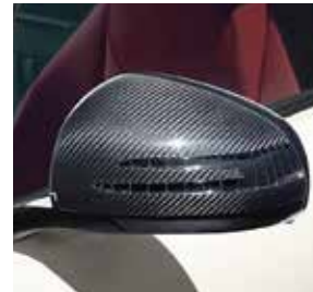
AMG Carbon Außenspiegel