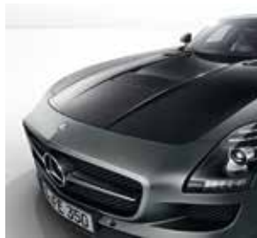
Motorhaube in Sichtcarbon