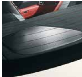
250-Watt-Subwoofer, Bang & Olufsen BeoSound AMG