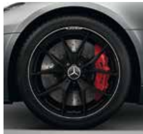
48,3 cm (19") / 50,8 cm (20") AMG Schmiederäder im Kreuzspeichen-Design (699)