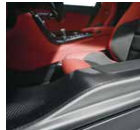
AMG Carbon-Paket Interieur