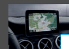
COMAND Online (531) € 2.118