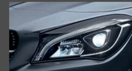
High-performance led-koplampen (632)