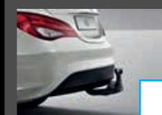
Trekhaak (550) € 956